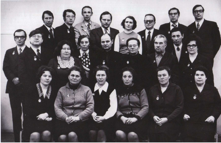
Партийно-хозяйственный актив КГУ. 1976 год