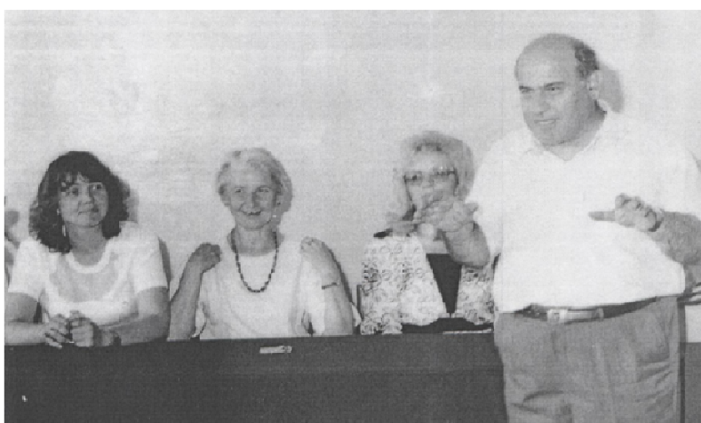
Госэкзамены, г. Тверь, 1982 г.