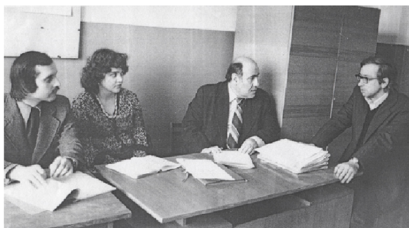
С учениками на кафедре, г. Тверь, 1979 г.