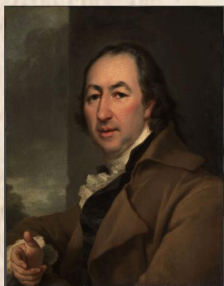
Н. И. Новиков

Основой фонда дореволюционной периодики Научной библиотеки Тверского государственного университета являются журналы по образованию и педагогике. Собрание насчитывает пятьдесят девять названий научных, научно-популярных, методических журналов, журналов для детского и семейного чтения. В основу фонда библиотеки Педагогического института, образованного в 1919 г., легли собрания Тверской земской женской учительской школы имени П. П. Максимовича, Постоянных педагогических курсов Тверского губернского земства и Тверского учительского института. В начале 1930-х гг. в библиотеку влились педагогические журналы Тверской мужской гимназии, ремесленного училища, Тверской духовной семинарии.