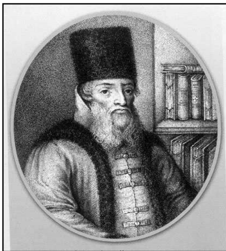
ОРДЫН-НАЩЕКИН Афанасий Лаврентьевич (1605-1680), крупный государственный деятель XVII в., дипломат.