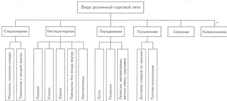
Виды розничной торговой сети

Денисова, И. Н. Организация и технология коммерческой деятельности в рисунках, схемах, таблицах. – М. : ИНФРА-М, 2003. – с. 115.